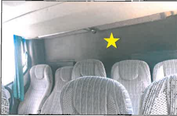
c.) Bagian belakang